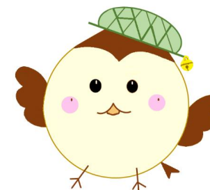
ハローワーク鈴鹿 就職応援キャラクター 『ハロちゅん』

◎ ハローワークでは随時紹介を行っており、すでに決定済となっている場合がありますので、ご了承ください。